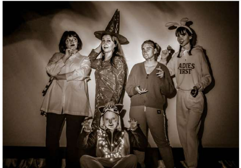
● В «Амплуа» занимаются студенты Института медицинского образования, Гуманитарного института и Института непрерывного педагогического образования НовГУ

После репетиции «дебютанты» всегда кратко обсуждают итоги занятия. Каждый студент рассказывает, чему смог научиться, а что хотел бы лично обсудить с режиссёром.