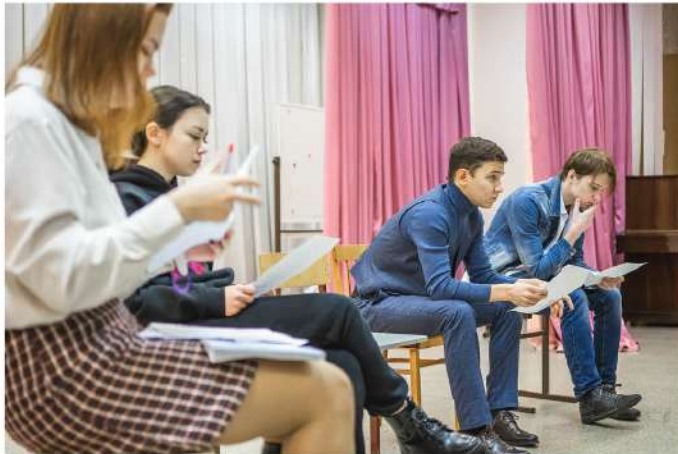
● Актёры «Дебюта» — будущие журналисты, филологи, педагоги и медики — разбирают роли перед очередным этюдом