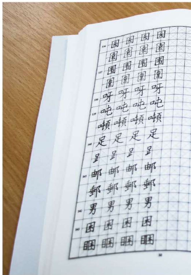
● Разговорный китайский студенты практикуют с носителями языка, приехавшими из Китая

— Я ощутила нехватку специального образования и методических навыков, поэтому поступила в мадридский Университет Антонио де Небриха, — говорит перуанка. — Прошла дистанционное обучение на преподавателя испанского языка для ино-