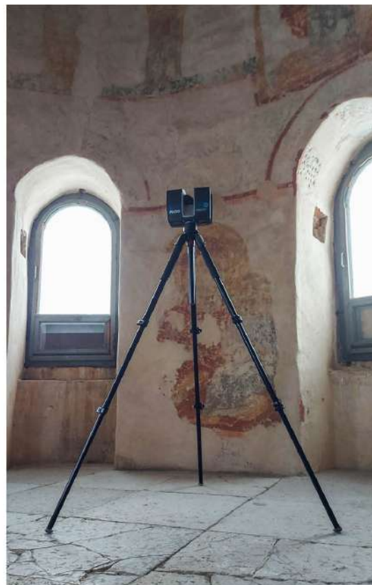
• Для создания цифровой копии архитектурного сооружения его сканируют изнутри и снаружи с разных ракурсов, снимают с квадрокоптера. Чтобы получить облако точек небольшого здания, требуется до пяти часов. На съёмку объекта, в котором много внутренних помещений, может уйти несколько дней

В работе над проектами участвуют лаборатории Передовой инженерной школы, Инжиниринговый центр