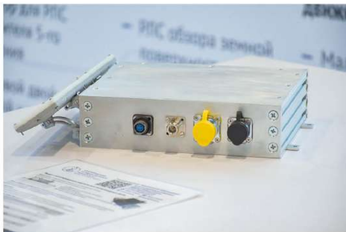
• Малогабаритные радиолокационные станции позволяют обнаруживать беспилотники в радиусе до 15 километров, контролировать и сопровождать их