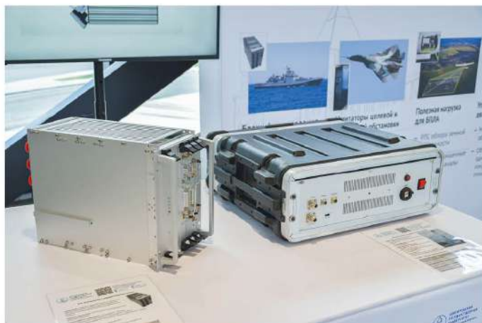
• Вычислители для РЛС и имитаторы воздушного пространства собираются в НовГУ и работают по разработанным в вузе алгоритмам. Программное обеспечение для их использования также создано новгородскими учёными