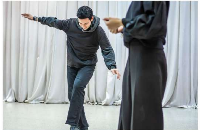
● Во время этюдов в студии «Амплуа» студенты учатся проживать обстоятельства, предложенные режиссёром: актёр должен верить, что идёт по канату над бездной

по специальности «режиссура самодельного театрального коллектива».