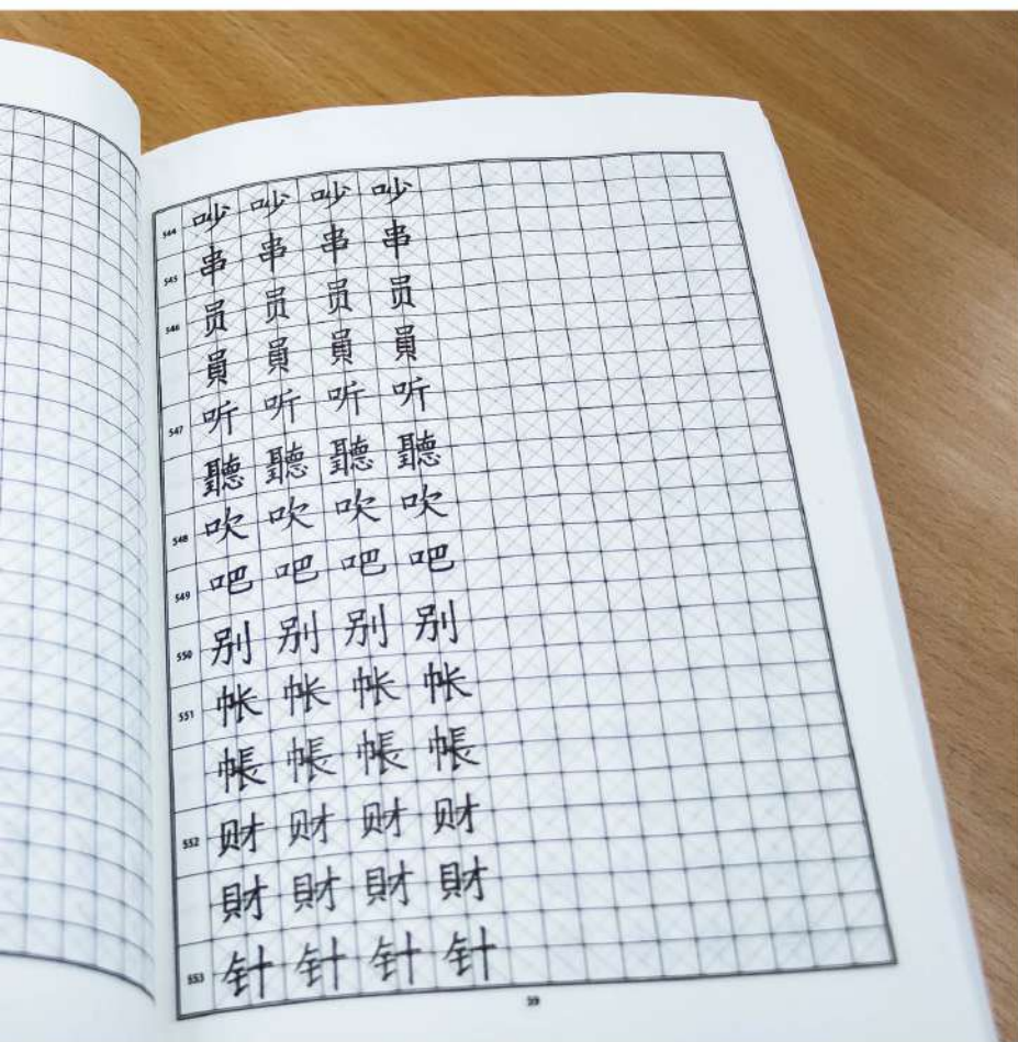
Имени учиться в НовГУ из Яньаньского университета