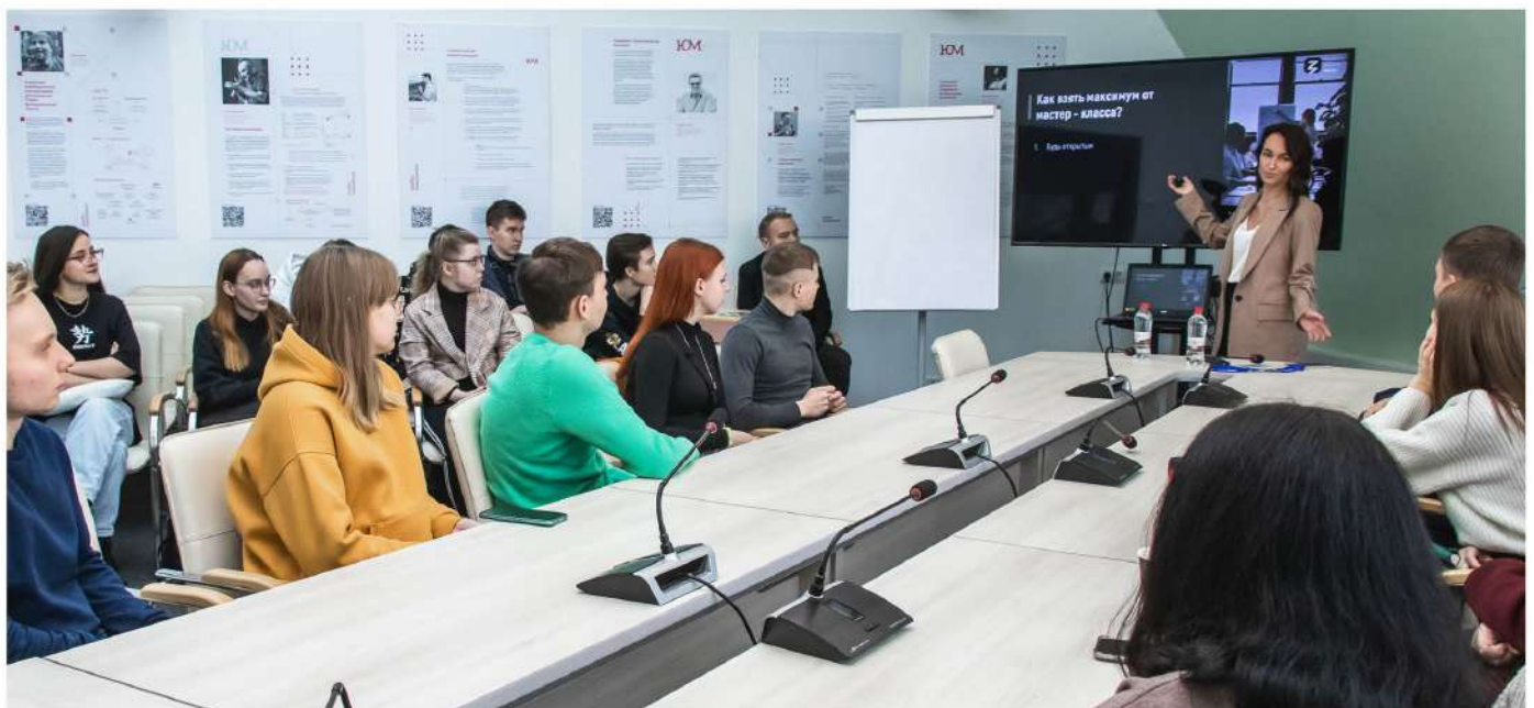
На бизнес-интенсиве «В деле» об инструментах продвижения своего проекта студентам рассказали эксперты общества «Знание»

Сейчас разрабатывается модель проектного обучения в магистратуре. Его планируют запустить осенью 2023 года.