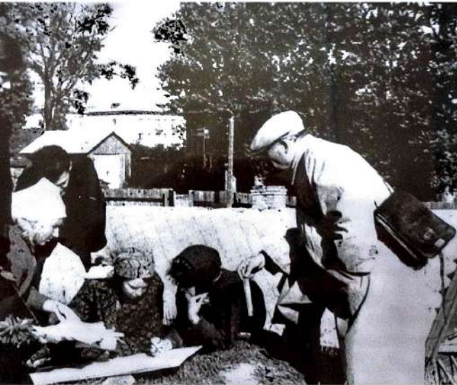
Экспедициям всегда всегда находилось место на раскопках, которые велись в 1956 году. Своя археологическая экспедиция в НГПИ появилась в 1956 году.