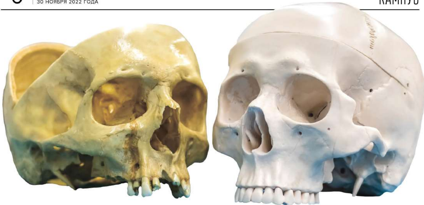
● Лаборатория должна сделать копии черепа, максимально похожие на настоящий