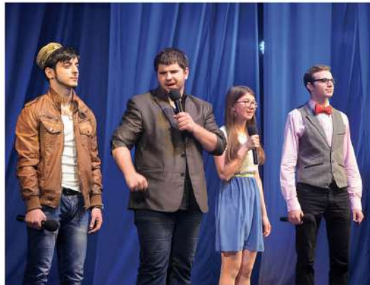
Победителями одного из последних финалов студенческой лиги КВН НовГУ в 2014 году стали студенты юридического факультета из команды «Уголовное тело»

Победители Кубка Ярослава Мудрого получают 50 тысяч рублей.