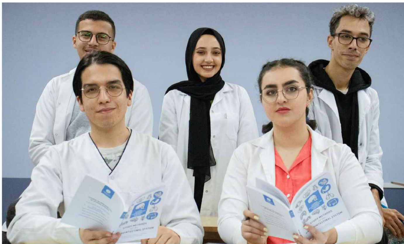
Поступая на англоязычные программы подготовки, студенты в процессе обучения осваивают и русскую речь