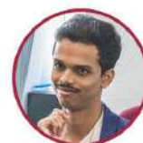
Танмей понимает русскую речь, но сам пока разговаривает с трудом