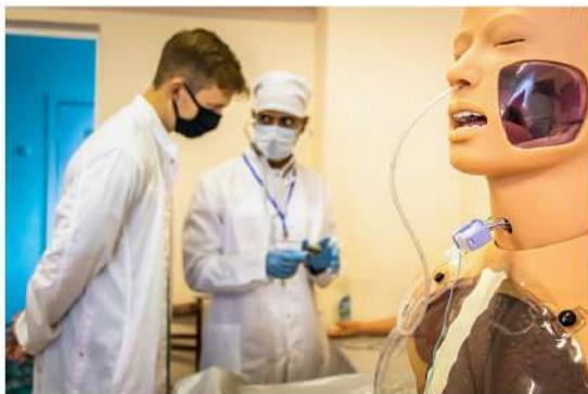
● Первокурсники-иностранцы проходят практику в аккредитационно-симуляционном центре под руководством практикующих врачей