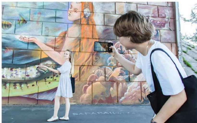
● Летом основание моста Александра Невского украсил мурал с русалкой. Непривлекательное до этого пространство стало популярным местом для фото на память у туристов, гуляющих по обновлённой Софийской набережной

В обновлённых арт-пространствах открывают рестораны, площадки для концертов и экспозиций