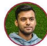
Хаснаин в будущем планирует продолжить обучение в Англии